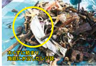
大阪湾で引き揚げられたごみ