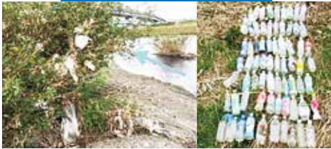
桂川に滞留したごみ

A 容器包装リサイクル法の関連省令の改正により、レジ袋の有料化が義務になります。使い捨てプラスチックによる海洋汚染の深刻化や地球温暖化などの解決に向けた第一歩として、レジ袋の有料化を通じて、消費者がマイバッグを持参するなど、ライフスタイルの見直しを促し、過剰な使用を抑えていくことが目的です。レジ袋削減に御協力をお願いします。