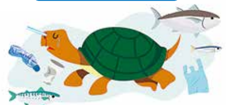
海洋生物への影響